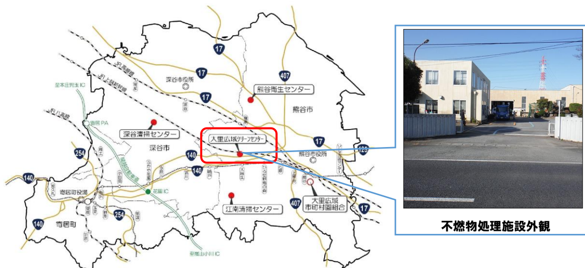
図3 不燃物処理施設の位置